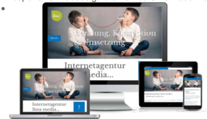
responsive Webdesign für die 3ma aus München

Bankverbindung: UniCredit Bank AG BIC: HYVEDE33XXX IBAN: DE44700202700010030313