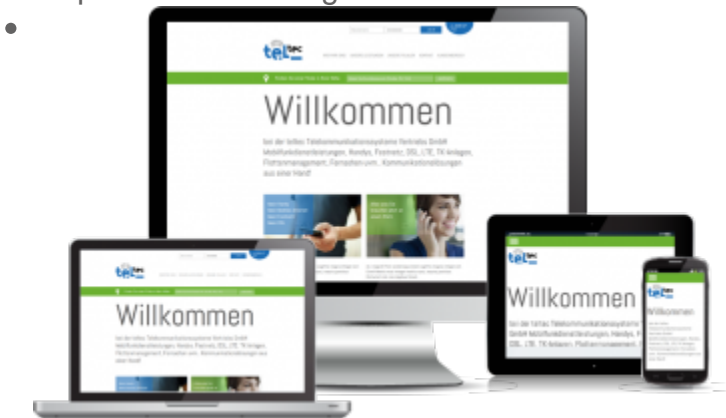
responsive Webdesign die TelTec GmbH aus München