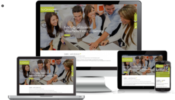
responsive Webdesign für hoQMee aus München